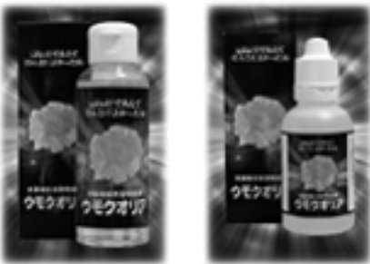
水溶性珪素含有食品「ウモクオリア」 日本珪素医学学会承認品 7,300円 (100ml) 4,000円 (50ml)